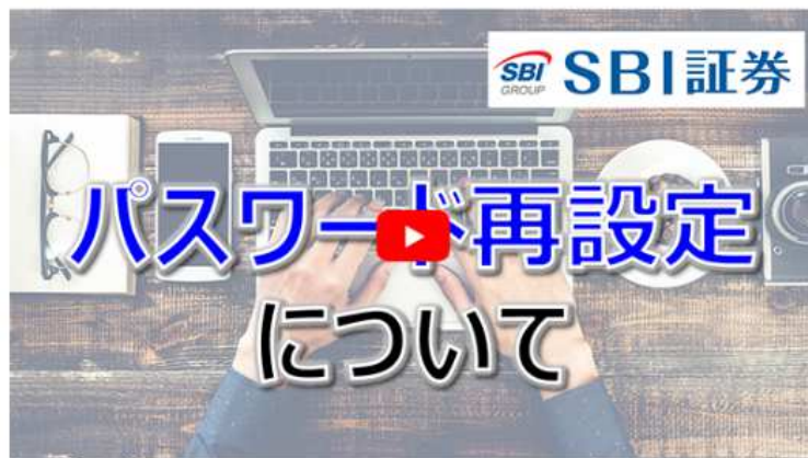
パスワード再設定方法について